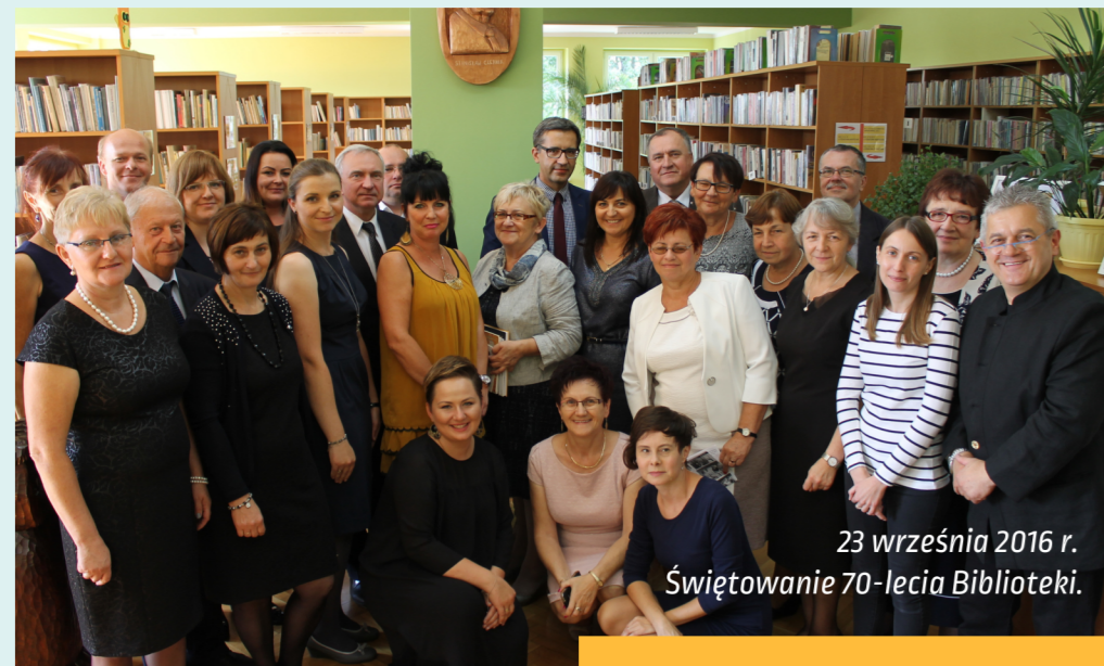
23 września 2016 r. Świętowanie 70-lecia Biblioteki.